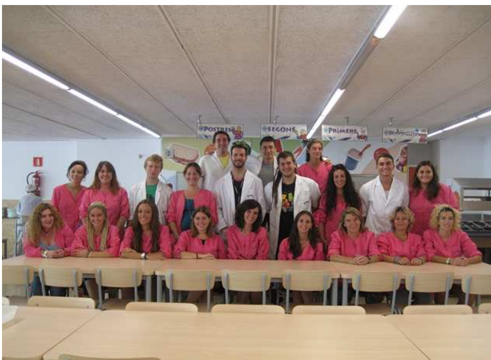
Equip de monitor de menjador, foto amb moltes monitores veteranes i ex-alumnes