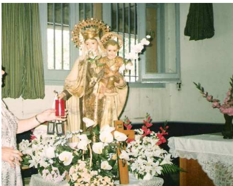
Capella del Carme, al vestíbul de l'escola.