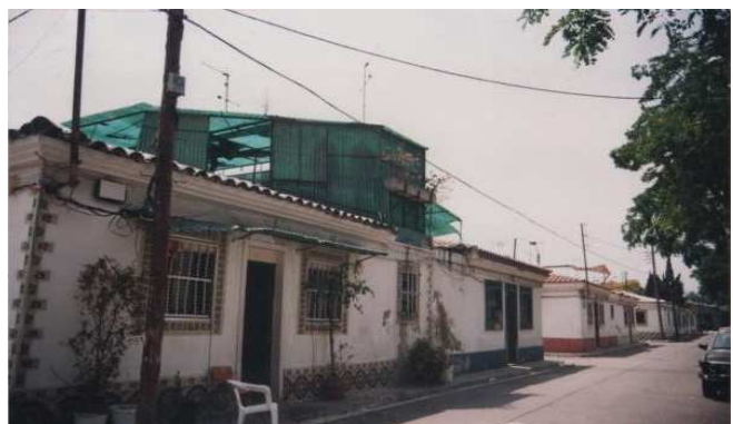
Un carrer del barri d'Eduard Aunós. Les cases barates.