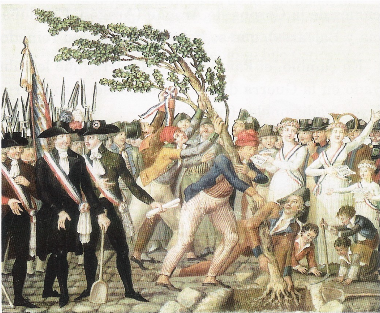
Plantación de un árbol en 1790, símbolo de la libertad alcanzada con la Revolución francesa.